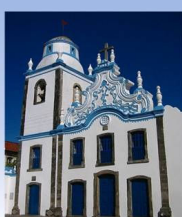
Igreja Barroca do Galo