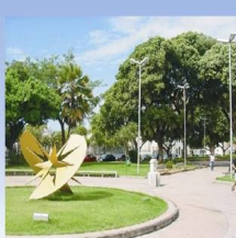
Marco zero de Natal-RN