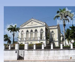
Solar Bela Vista