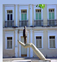
Memorial Câmara Cascudo