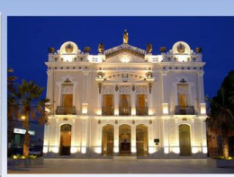
Teatro Alberto Maranhão