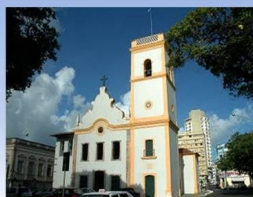
Catedral velha de Natal-RN