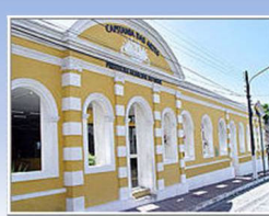
Capitania das artes