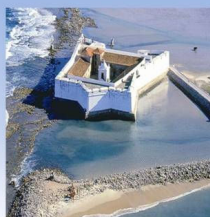
Forte dos Reis Magos